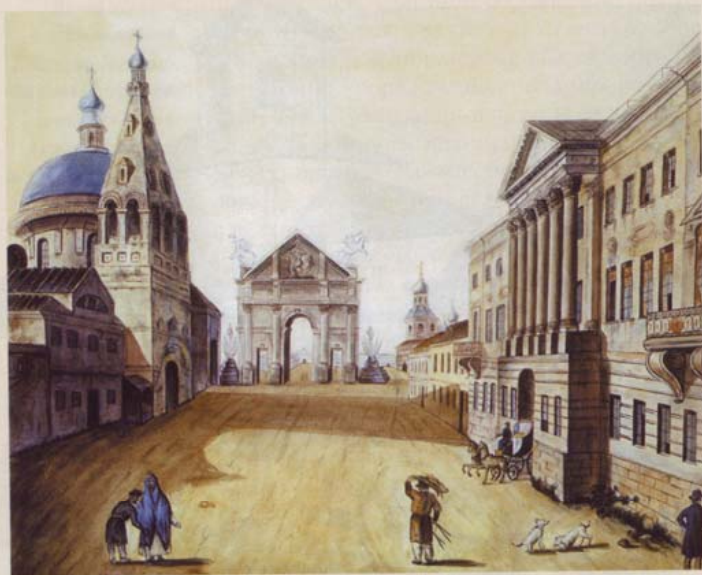
Вид Тверской улицы. Слева от Тверских ворот – храм во имя великомученика Димитрия Солунского, справа – колокольня Страстного монастыря. Художник Ф.Я. Алексеев. 1810 год

собора, находящегося на втором плане, но сохраняющего главенствующее значение в композиции комплекса (16, 79).