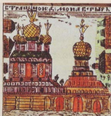
Страстной монастырь. Лубок. Середина XVIII века

Внешний вид собора и колокольни того времени хорошо представлен на лубке XVIII века. Колокольня имела черепичную главу с «травчатым» просечным позолоченным крестом – таким же, как и над главами