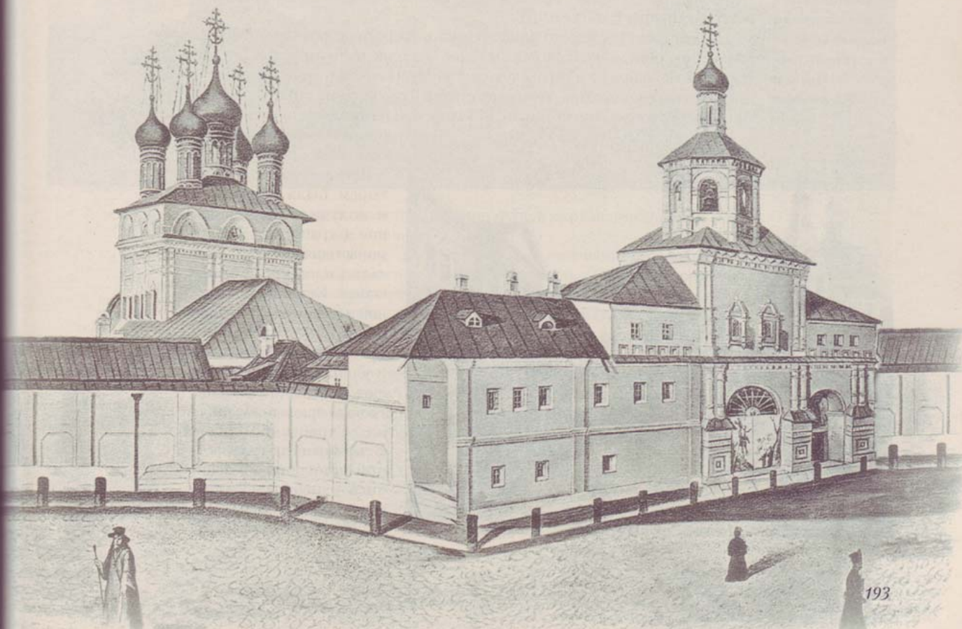
Страстной монастырь. Общий вид обители до перестройки колокольни и стены. Литография