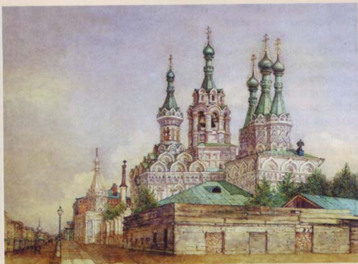
Храм Рождества Богородицы в Путинках. Неизвестный художник. Вторая половина XIX – начало XX века