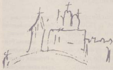
Рисунок А.С. Пушкина из рукописи романа «Евгений Онегин» с изображением (предположительно) Страстного монастыря; слева – церковь Рождества Богородицы в Путинках

Страстной монастырь. Неизвестный литограф по рисунку А. Феррари. 1860 год