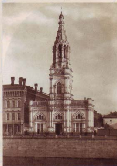
Колокольня храма Софии Премудрости Божией. Фотография начала XX века

Знаменательно, что в это время (в 1875–1890 годах) игуменьей монастыря была Евгения (Озерова), человек высокой культуры, одна из немногих и первая из монашествующих женщин-мемуаристов XIX века. Она обладала образным литературным языком и оставила дневник с воспоминаниями о людях (в том числе о митрополите Филарете) и событиях того времени. В 1876 году ею было составлено первое и единственное историческое описание Страстной обители на