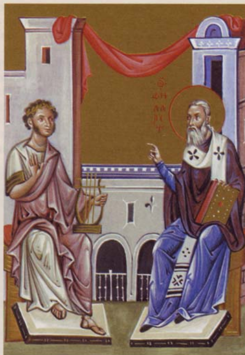
Миниатюра из «Жития святого Филарета Московского». Архимандрит Зинов (Теодоров). Конец XX века

Новая, величественного вида колокольня Страстного монастыря, с которой великолепно просматривалась Тверская улица и открывался вид на Кремль, вывела его в ряд крупнейших доминант города, среди которых – к тому времени уже построенный в своей основе Храм Христа Спасителя, колокольня Ивановского монастыря и церковь-колокольня Взыскания погибших при храме святой Софии на Софийской набережной напротив Кремля. В размещении новых укрупнённых доминант вокруг