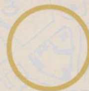
Ивановский женский монастырь. Разрушен в годы богоборчества