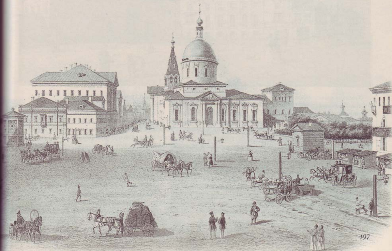
Вид Страстной площади в середине XIX века. Акварель И.И. Шарлеманя. 1853 год. Слева – колокольня и стена Страстного монастыря, справа – церковь великомученика Дмитрия Солунского