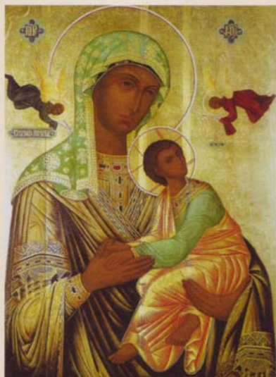
Страстная икона Божией Матери – святыня обители, ныне пребывающая в московском храме Воскресения Христового, что в Сокольниках

В 2004 году Страстному женскому монастырю исполнилось бы 350 лет. Находился он в одной версте от Московского Кремля на Страстной (ныне Пушкинской) площади. Монастырь был создан во имя чудотворной иконы Божией Матери Страстной, на которой по обеим сторонам от лика Богородицы были изображены два Ангела с орудиями Страстей Господа нашего Иисуса Христа – крестом, губою (губкой) и копием. Другого монастыря, посвящённого Страстной иконе Божией Матери, в Отечестве нашем никогда не было.