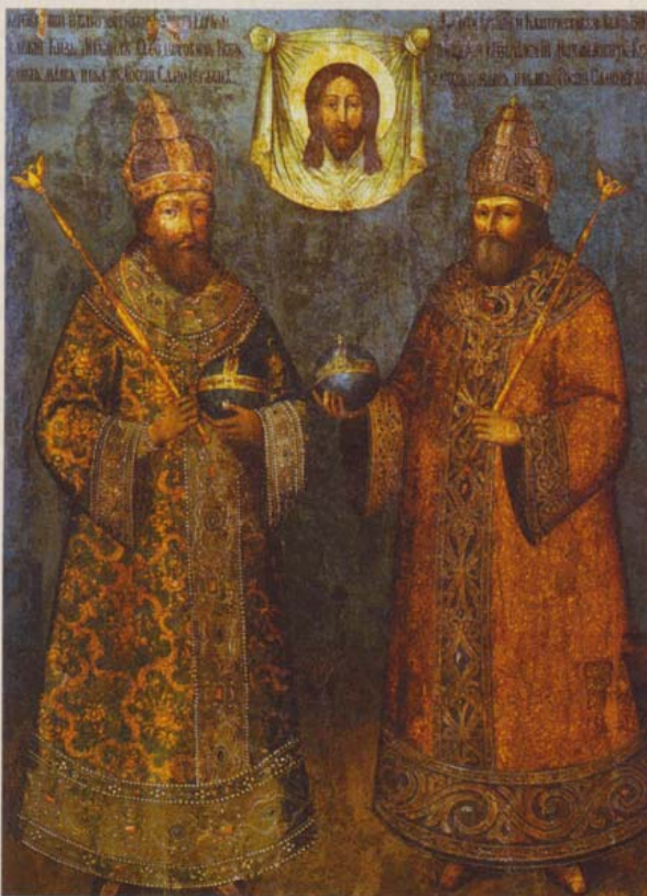
Икона «Царь Михаил Феодорович и Царь Алексей Михайлович, предстоящие перед образом Спаса Нерукотворного». Феодор Зубов. 1678 год

Существовала также идея преемственности Москвою духовного наследия и миссии «Вечного города Иерусалима», которую развивал Патриарх Никон, считавший, что Москва должна стать духовным светочем для всего человечества (9, 187). Царь Алексей Михайлович разделял это мнение, однако Патриарх отдавал предпочтение духовному началу, в то время как Государь – внешнему, военно-политическому могуществу России. В борении идей была нарушена гармония взаимоотношения царской и церковной властей, а в дальнейшем в связи с политикой сына Царя Алексея Михайловича – Императора Петра I это расхождение обернулось негативными последствиями для духовно-общественной жизни России. Правителям была присуща «гордость