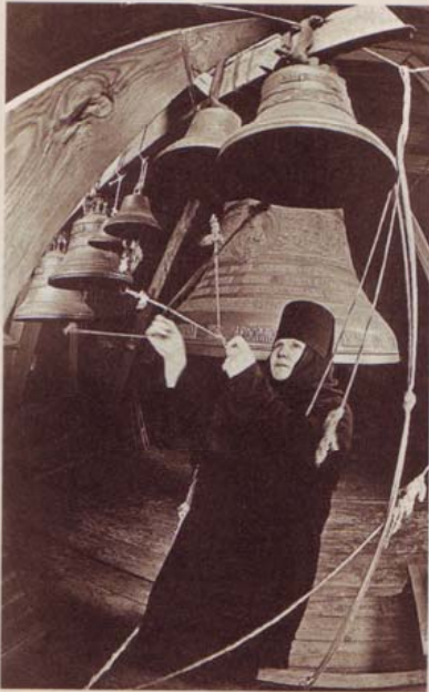
Во дни торжеств и бед народных

в яме и более чем скромны по своим архитектурным достоинствам.