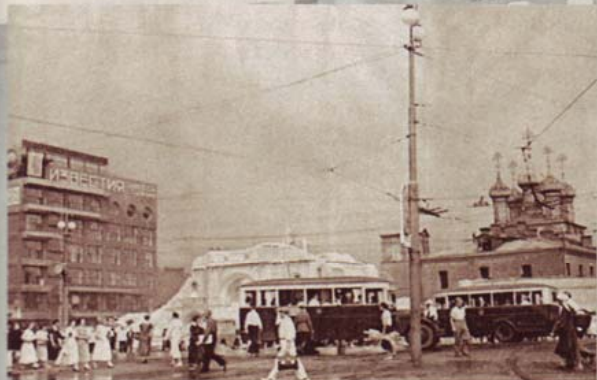
Москва. Страстная площадь. Уничтожение обители. Как это было... И день сегодняшний