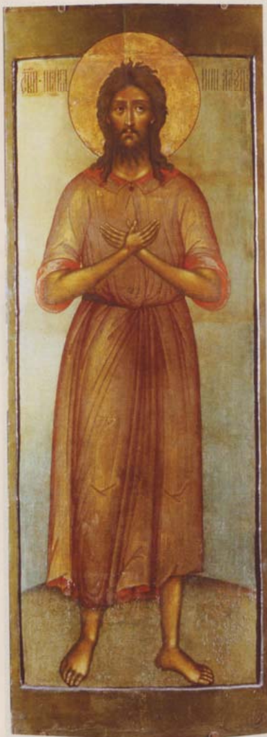
Икона «Святой преподобный Алексий, человек Божий». Вторая половина XVII века. Государственный Исторический музей

человеческая, открывшая в сердце двери искусственным страстям». Здесь уместно напомнить и о страстях в упомянутом выше втором значении этого слова – о душевной нечистоте и пороках, от которых просила людей Пресвятая Богородица, явившись страждущей женщине.